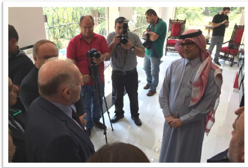
بخاري ورزق يتحادثان