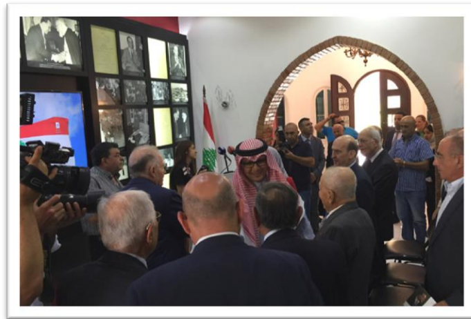
وصول القائم بالأعمال السعودي

ثم جال الضيف الكريم في أرجاء المتحف وإطلع على موجوداته ودوّن كلمة في السجل الذهبي للمتحف.