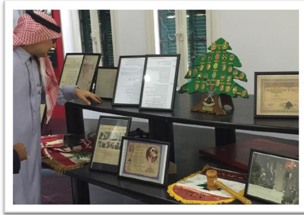
بخاري يجول في المتحف