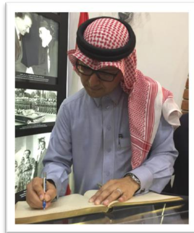
تدوينة القائم بالأعمال في السجل الذهبي للمتحف