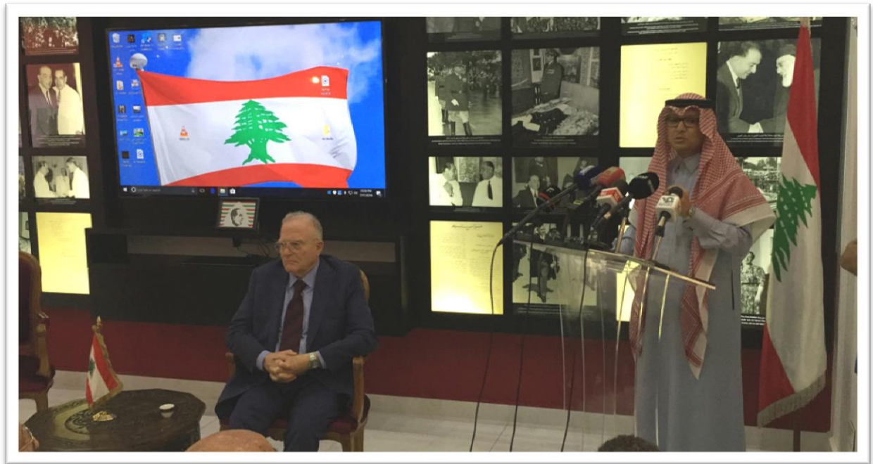
كلمة القائم بالأعمال السعودي بخاري