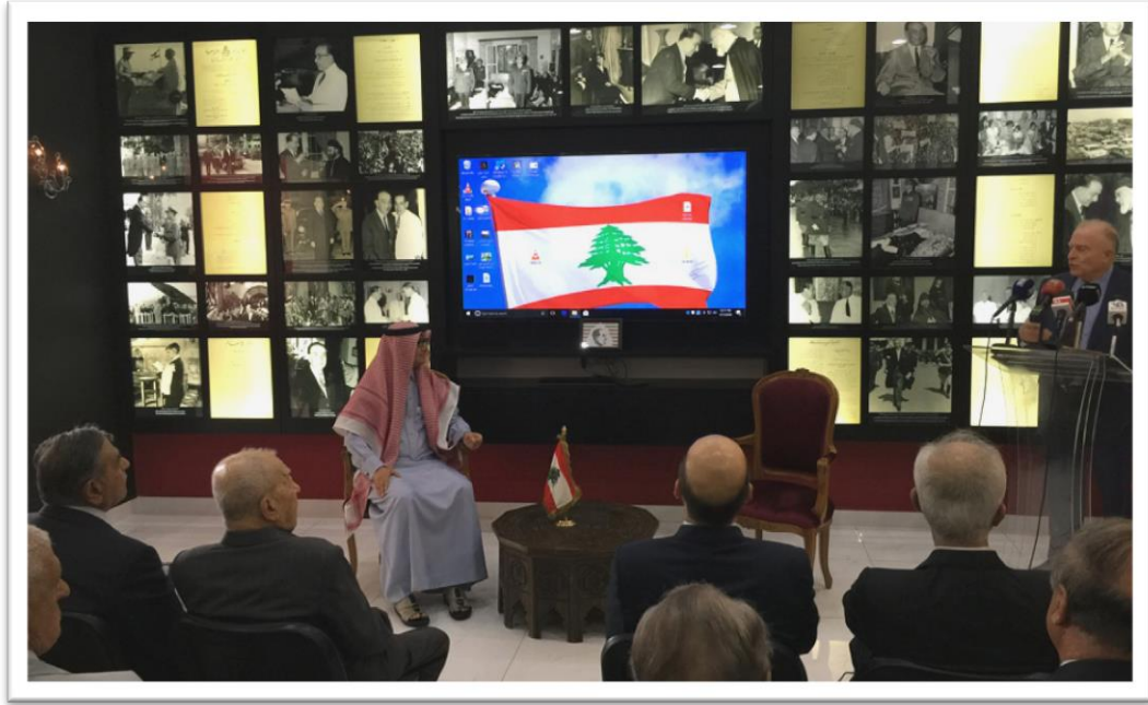
كلمة الدكتور رزق