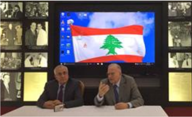
الرئيس سليمان والدكتور رزق يتكلمان في المناسبة