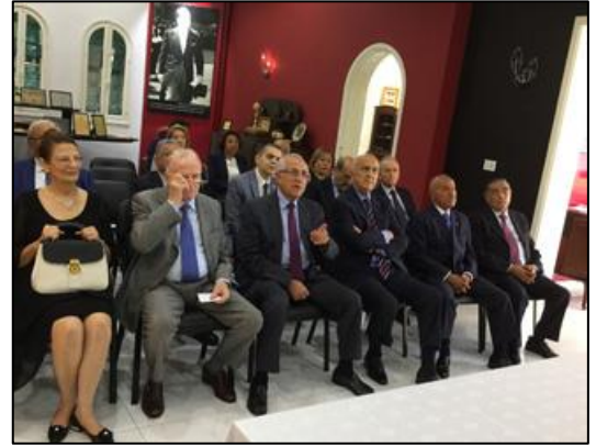
متابعة الفيلم الوثائقي