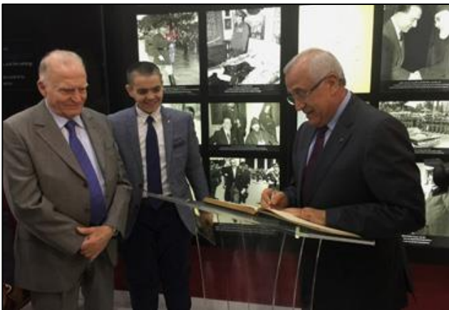
الرئيس سليمان يكتب في السجل الذهبي