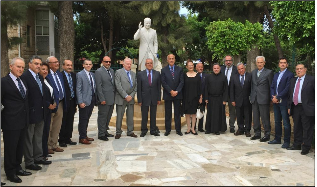
صورة جامعة للحضور أمام تمثال للرئيس الراحل، في الباحة الخارجية للمتحف