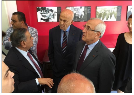
الرئيس سليمان، الوزير السابق مقبل والعميد ناصيف