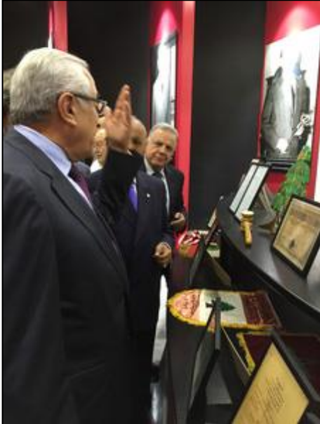
الرئيس سليمان يجول في المتحف

المتواضع الذي نعتزّ بزيارته اليوم، كما نعتزّ وأعتزّ أنا شخصياً أنني من مدرسة الجيش التي أسسها..."