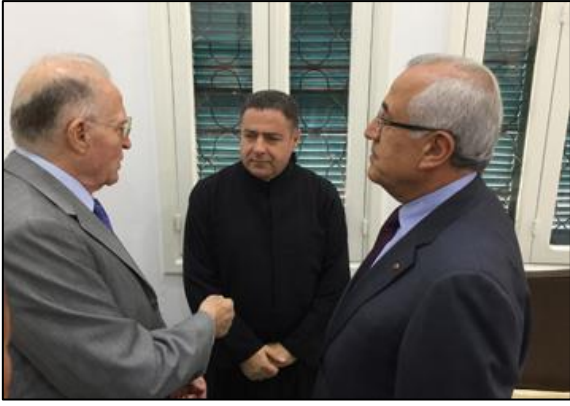
الرئيس سليمان مع الأب سقيم والدكتور رزق