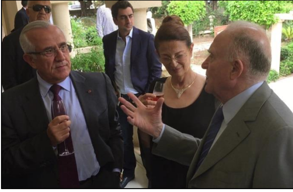
الرئيس سليمان، الدكتور رزق والوزيرة السابقة شبطيني