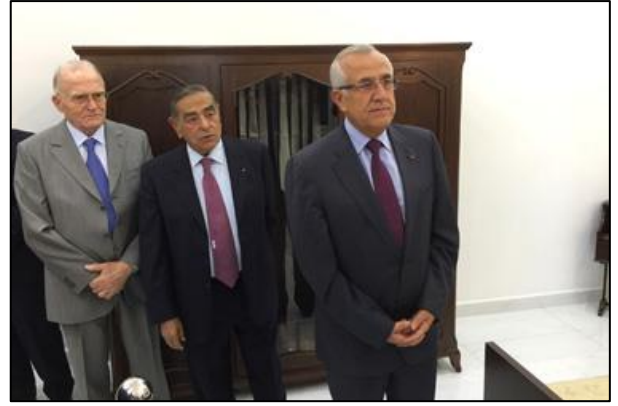
في غرفة نوم الرئيس شهاب