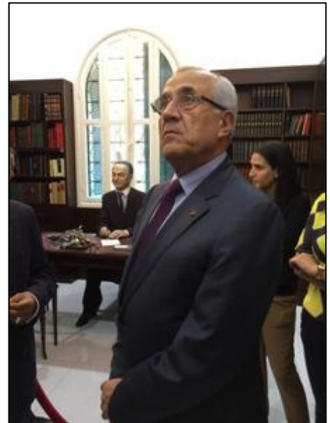
في مكتب الرئيس شهاب الخاص